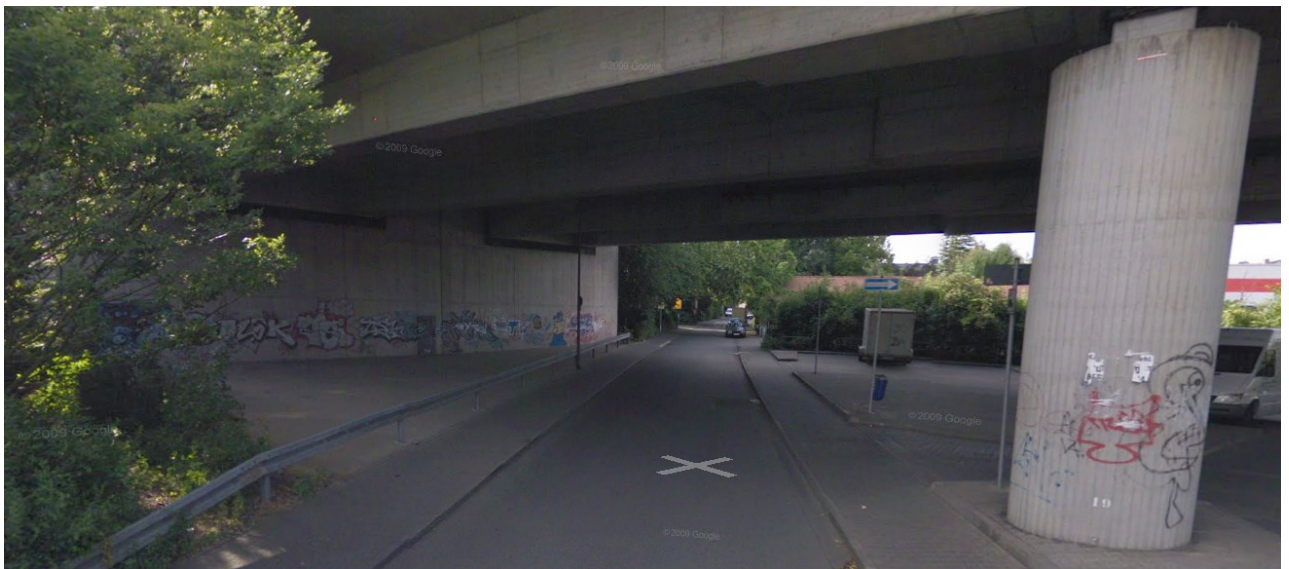
Bild 4. Mit geeigneten Mitteln kann der Bereich mit Farbe und schönen Graffitis auf Dauer aufgewertet werden.