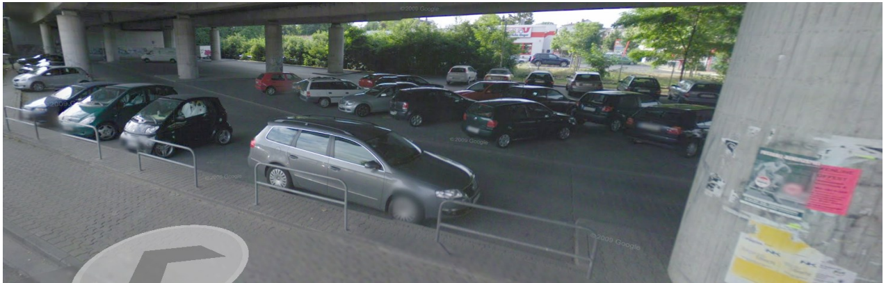
Bild 3. Einige gute Ideen wären nötig, um die langweilige in eine ansehnliche Atmosphäre zu verwandeln.